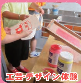
工芸デザイン体験