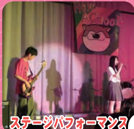
ステージパフォーマンス