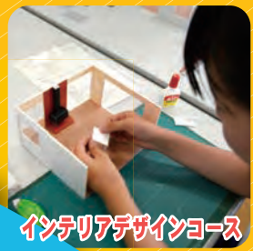
インテリアデザインコース