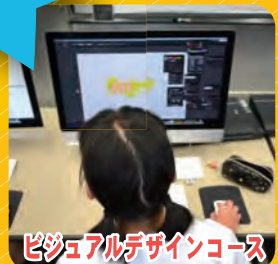
ビジュアルデザインコース